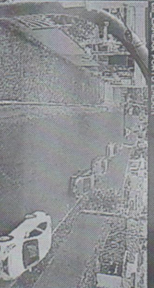
09 CANEIA PORTO ENGIN