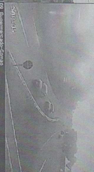
05 Rua da Discórdia