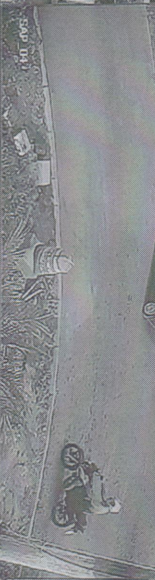
12 Saída Maurício