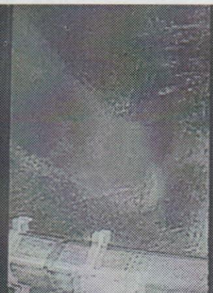
SAP_23 Y14 B