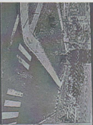
07 Rua da Boa Visagem