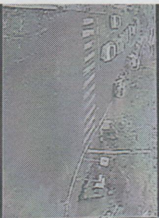
04 Rua Centro