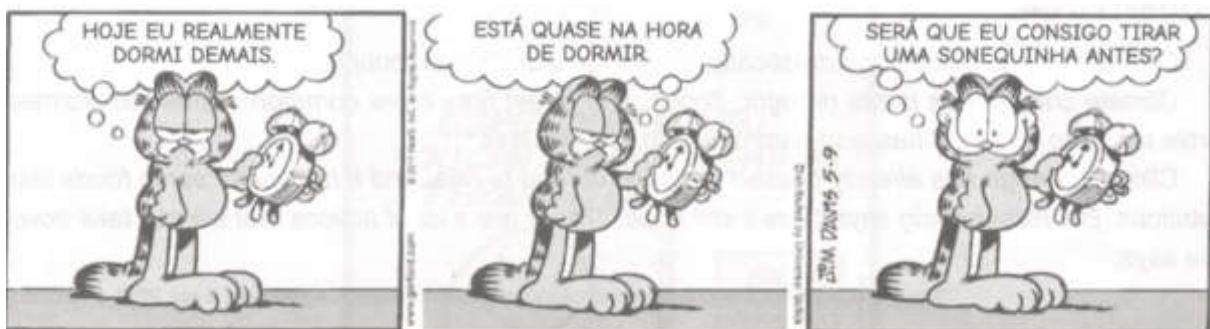
Jim Davis. Garfield . (Adaptado)

8 – Garfield é um gato conhecido por ser comilão e preguiçoso.