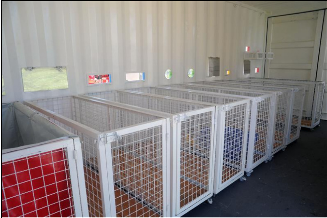
Imagem 4 - demonstração dos carrinhos internos do container.