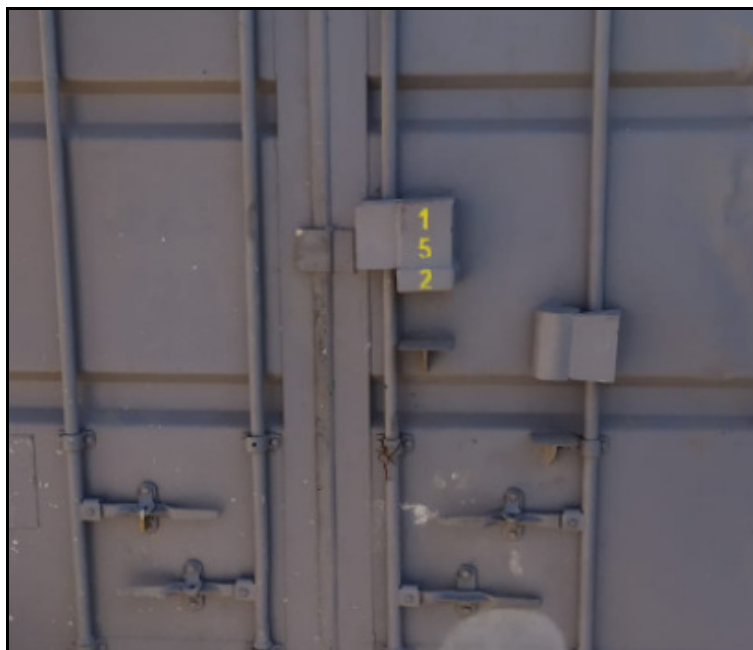
Imagem 1 - demonstração do dispositivo em aço com a finalidade de proteger o cadeado do container

a. O dispositivo em aço contra vandalismos que visa proteger o cadeado do container descrito neste Termo de Referência deverá ser construído de forma a evitar o livre acesso ao cadeado, bem como a sua destruição com o uso de ferramentas, à semelhança da Imagem 1, ilustrativa para fins de compreensão;