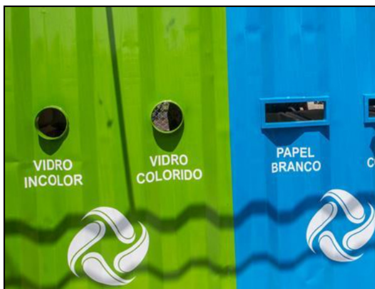
Imagem 2 - demonstração dos cortes e acabamentos das aberturas do container

b. Os cortes e acabamentos das doze aberturas descritas neste Termo de Referência deverão ser executadas à semelhança da Imagem 2, ilustrativa para fins de compreensão das aberturas solicitadas;