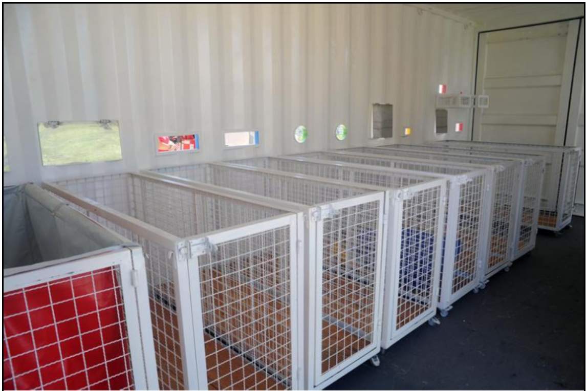
Imagem 3 - demonstração dos carrinhos internos do container.