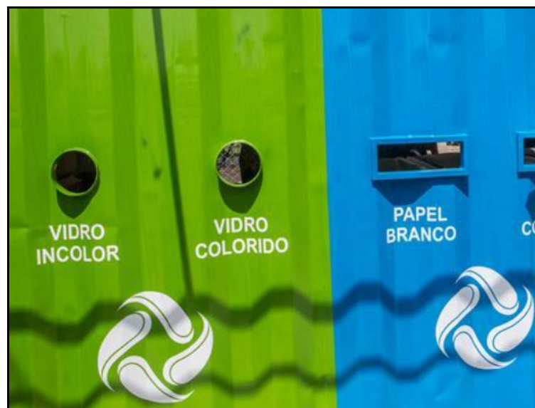
Imagem 1 - demonstração dos cortes e acabamentos das aberturas do container

A. Os cortes e acabamentos das doze aberturas descritas neste Termo de Referência deverão ser executadas à semelhança da Imagem 1, ilustrativa para fins de compreensão das aberturas solicitadas;